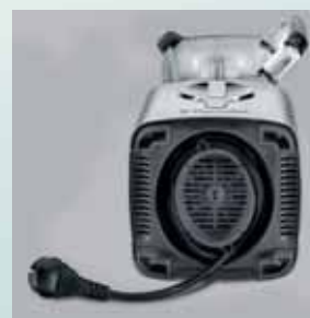
Suport cablu de alimentare