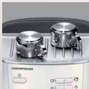
Suport de încălzire cești, din oțel inoxidabil