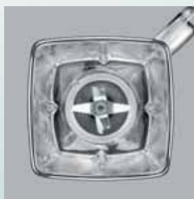
Cană pătrată cu lame zimțate