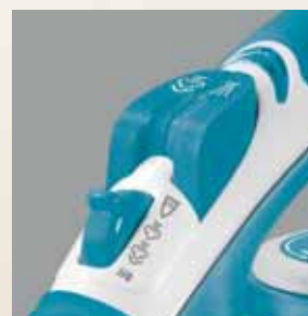
Funcția de auto-curățare prelungște durata de viață a fierului