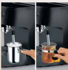
Funcție abur și apă fierbinte