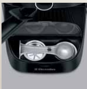
Cutie depozitare filtre