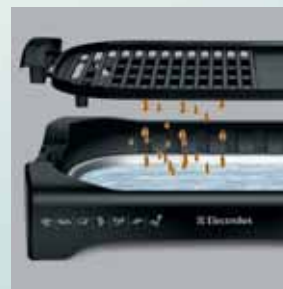
Prăjire fără grăsimi și fără fum