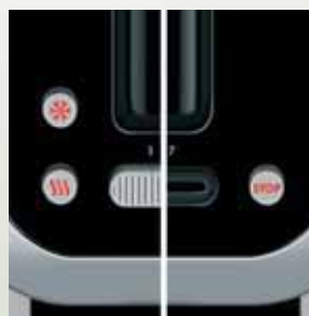
Butoane de Dezghețare și Reîncălzire, cu indicator luminos