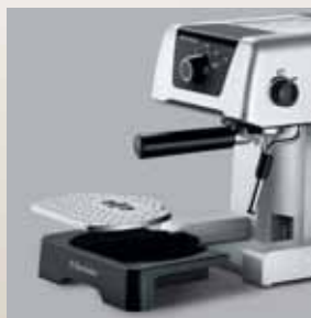
Tăviță colectoare detașabilă