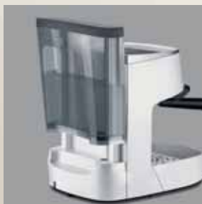
Rezervor de apă detașabil