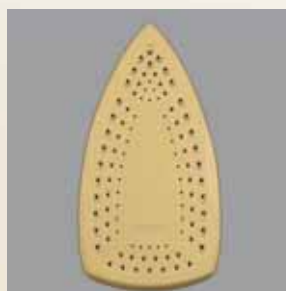
RESILIUM™ SUPERIORglide™ - talpă rezistentă la zgârieturi