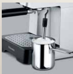
Duză specială pentru apă fierbinte și abur