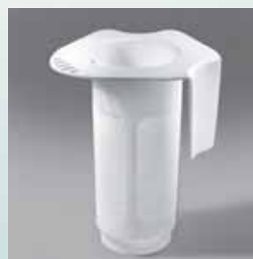
Filtru pentru extragerea sucului