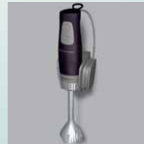
Suport de perete