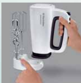
Buton de desfacere ușoară