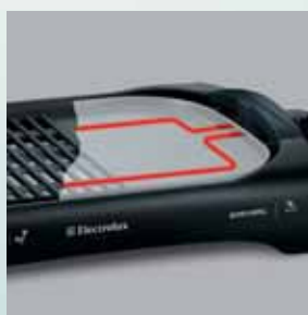
Element de încălzire încastrat