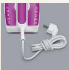
Cablu de alimentare textil cu o lungime de 1,8 m, cu clemă, 360° flexi, cu suport depozitare