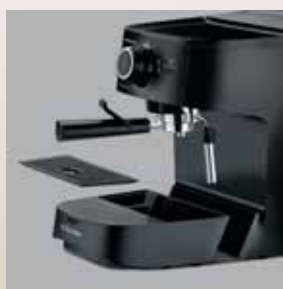
Tăviță detașabilă din plastic pentru scurgerea apei