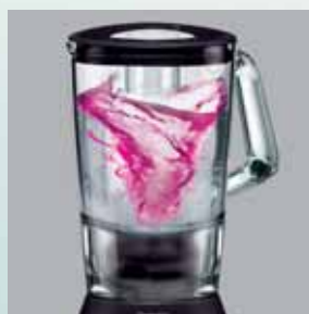
Performanță excelentă de amestecare