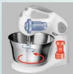
Bol rotativ cu motor separat