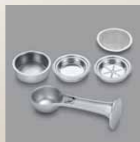
Unități de măsură - 1 sau 2 cești, site adiționale pentru filtrele de hârtie