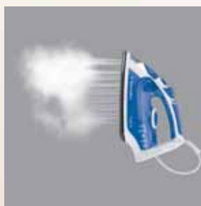
110 g/min steam shot