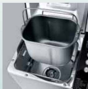
Lamă tăiere pentru scoaterea ușoară din formă