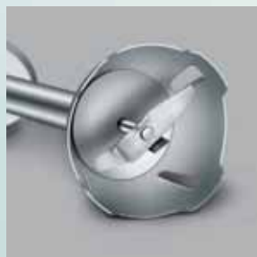
Lame din inox