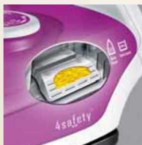
Cartuș anti-calcar încorporat