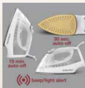
PERFECT™ Safety: Triplă siguranță – închidere automată