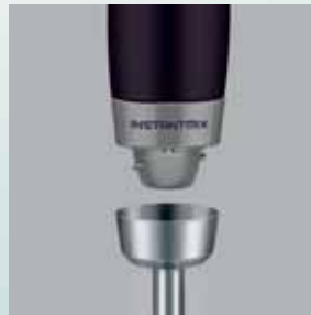
Ax de mixare detașabil