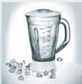
Funcție pentru zdrobit gheața