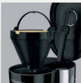
Suport filtru detașabil (mărime 1 x 4)

PNC 910 011 858 (EAT 3130) PNC 910 011 857 (EAT 3100)