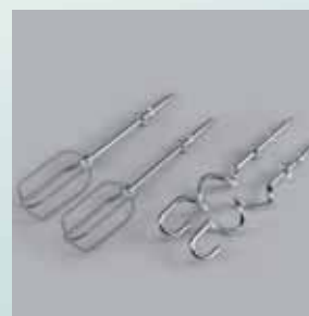
Accesorii din inox