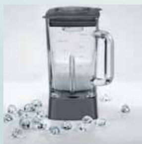
Funcție pentru zdrobirea gheții