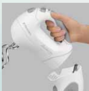
Mixer de mână detașabil