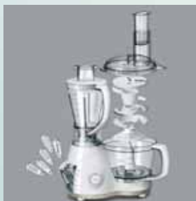
Toate accesoriile se depozitează în robot