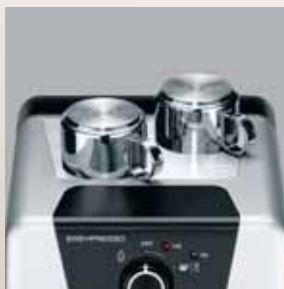
Suport inox pentru încălzirea ceștilor