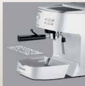
Tăviță detașabilă din oțel inoxidabil