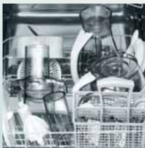
Componentele se pot spăla în mașina de spălat vase