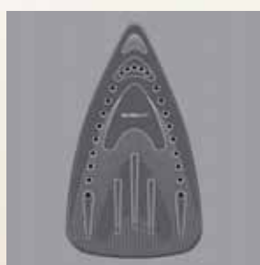
Talpă GLISSIUM™ pentru alunecare superioară