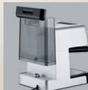
Recipient detașabil pentru apă