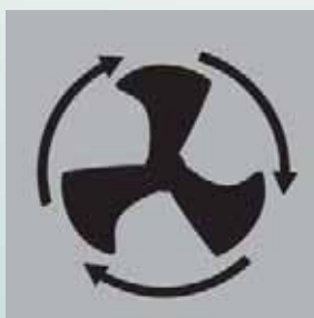
Ventilo-convector pentru o crustă crocantă