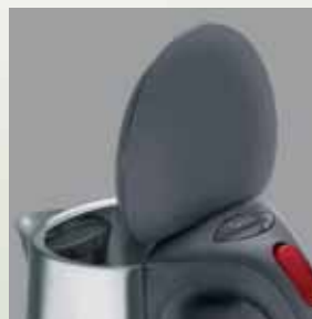
Deschidere cu o singură mână